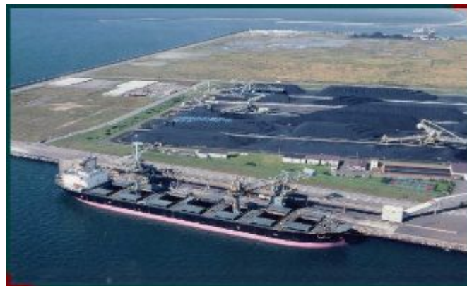
苫東コールセンター

同社は、1985年1月から本格的に営業を開始し、電力会社等の海外炭輸入中継基地として順調に稼働を続け、2010年度の取扱量は344万トンとなっております。