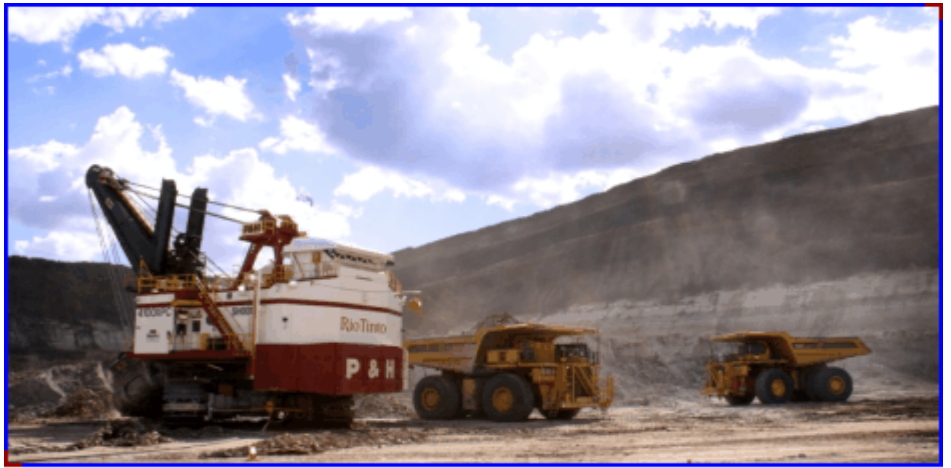
Clermont Coal Mine

今後、クレアモント炭鉱は、年間1,200万トン規模まで生産を伸ばし、そのうち当社は、年間約200万トンを経営し、日本の電力会社向けに販売する予定としております。